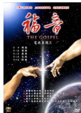
《福音》四集（約220分鐘） 語言：中文、英文、粵語