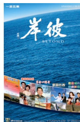
《彼岸》十集（約500分鐘） （2010年底發行）