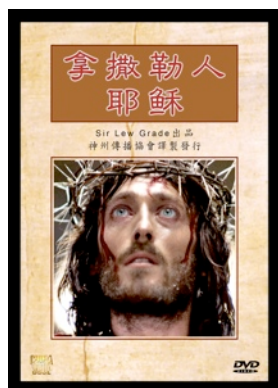
《拿撒勒人耶穌》（約360分鐘） 語言：中文